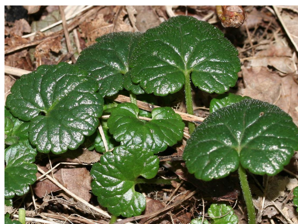
Bladeren van Hondsdraf lijken een beetje op deze van Goudveil.

Zoals de naam aangeeft kan je beide Goudveilsoorten uit elkaar halen door de bladstand, tegenoverstaand (paar)- of verspreidbladig.