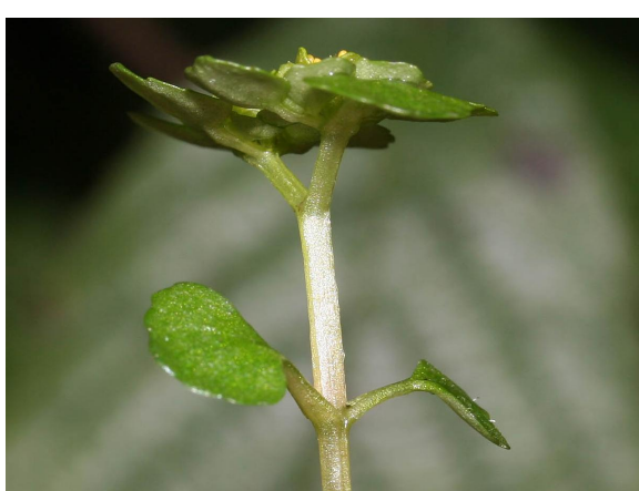
Paarbladig goudveil, let op de tegenoverstaande bladeren.

Goudveilsoorten zijn vrij kleine kruipende planten die vooral opvallen door hun groengele, goudkleurige bloeiwijze op een donkergroene achtergrond van bladeren. De bladeren zijn rond, gekarteld en een beetje behaard. De stengel is sappig en doorschijnend. Ze groeien meestal in groep. Een paar plantjes alleen vallen vaak niet op.