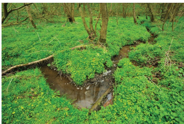
Bronbos met Goudveil, let op de geelgroene bloeiwijze.