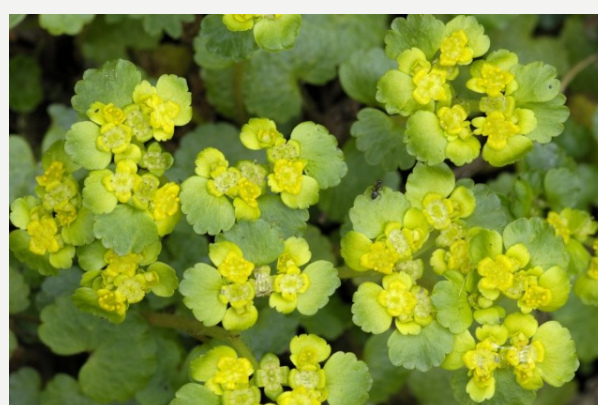
Paarbladig goudveil met de geelgroene bloeiwijze.

Chrysosplenium oppositifolium en C. alternifolium