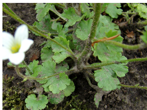
Kroezelig ingesnedene rozetblaadjes.

Knolsteenbreek kan niet meteen verwisseld worden met andere soorten in hetzelfde biotoop: vochtige, niet te voedselrijke hooilanden. De andere inheemse soort van de steenbreekfamilie, het Kandelaartje, is veel kleiner en groeit in droge omstandigheden.