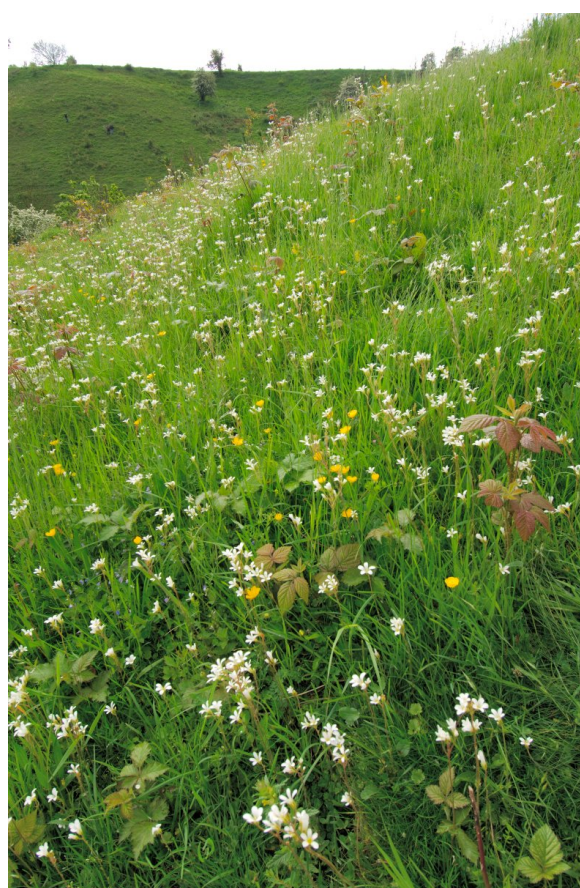
Knolsteenbreek in een kalkgrasland in Limburg.

Knolsteenbreek is een rozetplant. Onderaan bestaat de wortelrozet uit niervormige en kroezelig gekartelde blaadjes. De bloeistengel is bezet met klierharen en meestal zo'n 30 cm hoog, maar de plant kan tot 50 cm worden. Op de bloeistengel staan wat smallere, eerder waaivormige blaadjes. De bloemen zijn melkwit, ongeveer anderhalve cm groot en ze vormen een los trosje. Typisch zijn de kleine, bruine knolletjes die zich net boven de wortels aan de bladoksels bevinden.