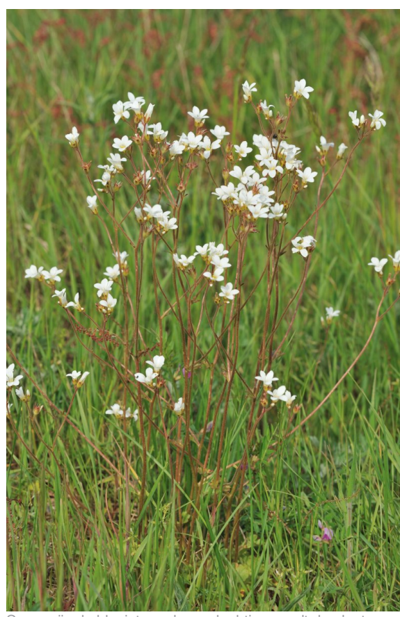
Soms zijn de bloeistengels roodachtig en valt de plant nog meer op.