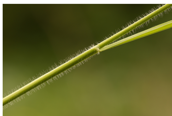
Heel de plant is behaard

Gestreepte witbol is een heel algemene, dichte pollen vormende grassoort die vooral in mei bloeit. De hele plant is dicht en fluweelachtig zacht behaard. De bladscheden vertonen vaak paarsrode lengtestrepen als een pyramabroekspijp. Daarvoor trek je best een deel van de plant uit de grond en kijkt net boven de wortels bij een aantal stengels. Gestreepte witbol behoort ook van een afstand tot de opvallendste grassen, vooral als hij met roze tot lichtpurperen pluimen massaal de hooilanden tooit.