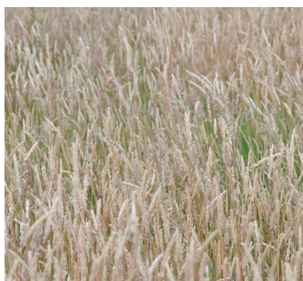
Na de bloei blijft een bruingeel veld over. Maaien heeft nu nauwelijks nog effect.