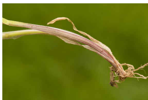
Heel typisch is de paarse streping bij de onderkant van de bladschedes