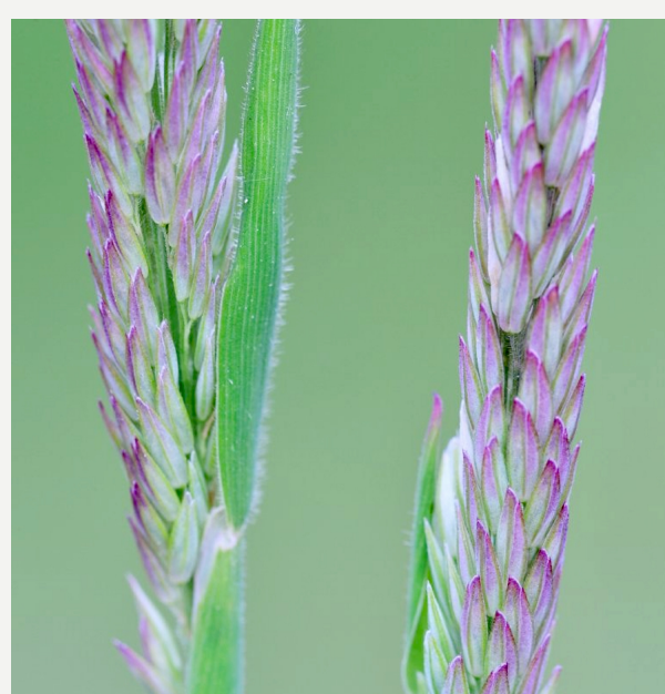
Gestreepte witbol heeft een paarse bloeiwijze.