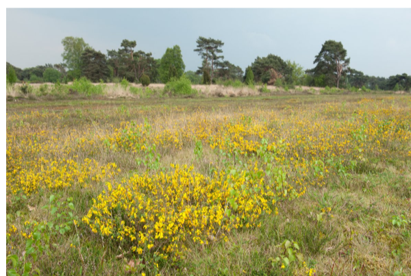
Stekelbrem in droog heidelandschap.

Stekelbrem heeft erg kleine priemvormige bladeren en is aan de oudere takken bezet met doorns.